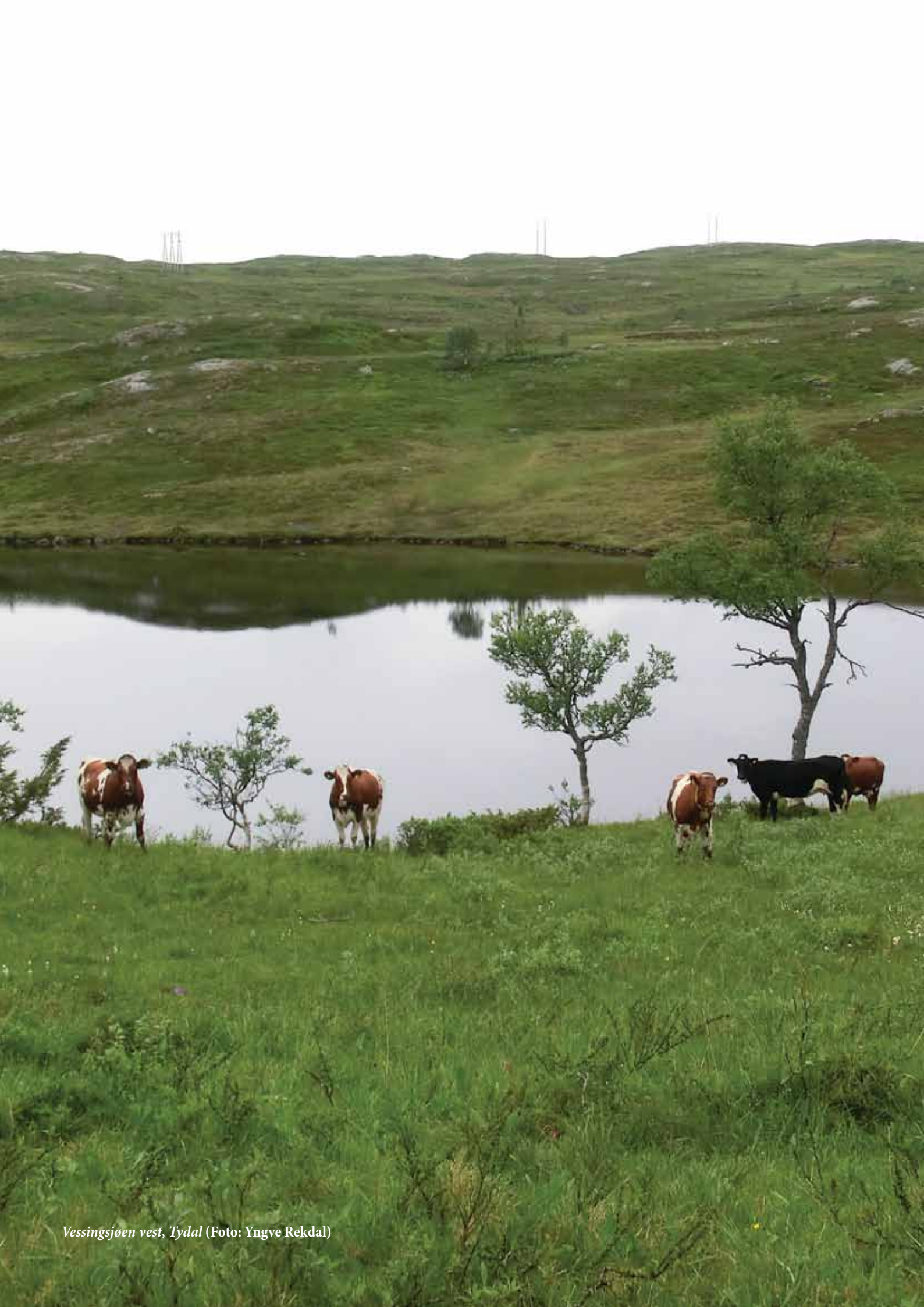
Vessingsjøen vest, Tydal