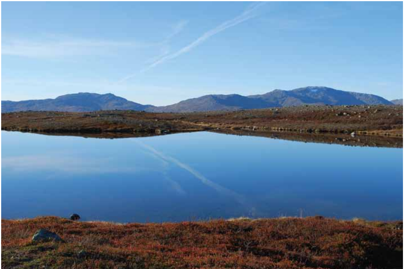
Sommer i Tydal med utsikt mot Fongen fra Karolinerleden

viklingen skjer gjennom «summen av de små skritt». Det er nødvendig å fokusere på videreutvikling av dagens bedrifter samtidig som det stimuleres til nyetablering innenfor områder der kommunen har fortrinn. En økning i privat næringsliv er nødvendig bl.a. med sikte på å gjøre lokalsamfunnet mindre avhengig av kommunale arbeidsplasser. Det må vektlegges tilrettelegging for offentlige arbeidsplasser og kompetansemiljø for å gjøre Tydal best mulig i stand til å møte framtidige strukturendringer.