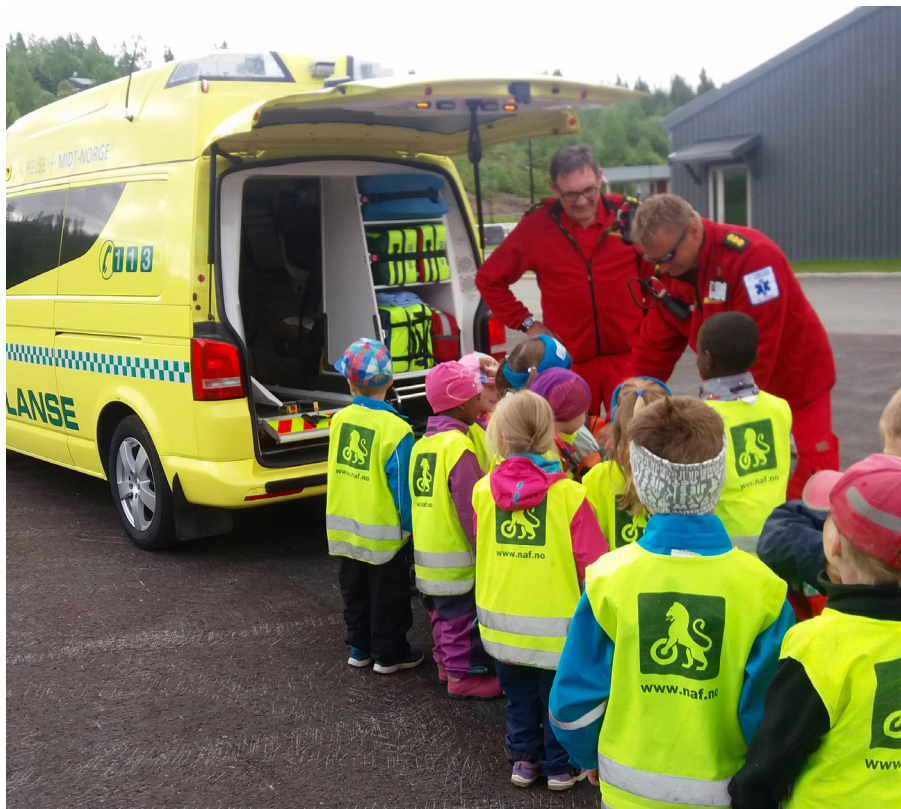
Barnehagen på besøk til ambulansetjenesten i Tydal

En viktig helsefremmende oppgave i Tydal vil være å tilrettelegge for at alle i befolkningen har et godt sosialt nettverk. Dette kan tilrettelegges på flere nivå. God infrastruktur for fysisk og sosial aktivitet handler om både fysisk og sosial tilrettelegging, for å øke inkludering og innbyggernes sosiale nettverk, som kan forebygge ensomhet. Frivillige lag og organisasjoner er bærebjelken for det sosiale livet i bygda. Det er derfor viktig for kommunen å støtte frivilligheten. Støtte til frivilligheten er drøftet i frivillighetsmeldingen for Tydal kommune. Folkehelse henger nøye sammen med sosial og økonomisk status. Det ligger derfor mye godt folkehelsearbeid i å motvirke sosial og økonomisk