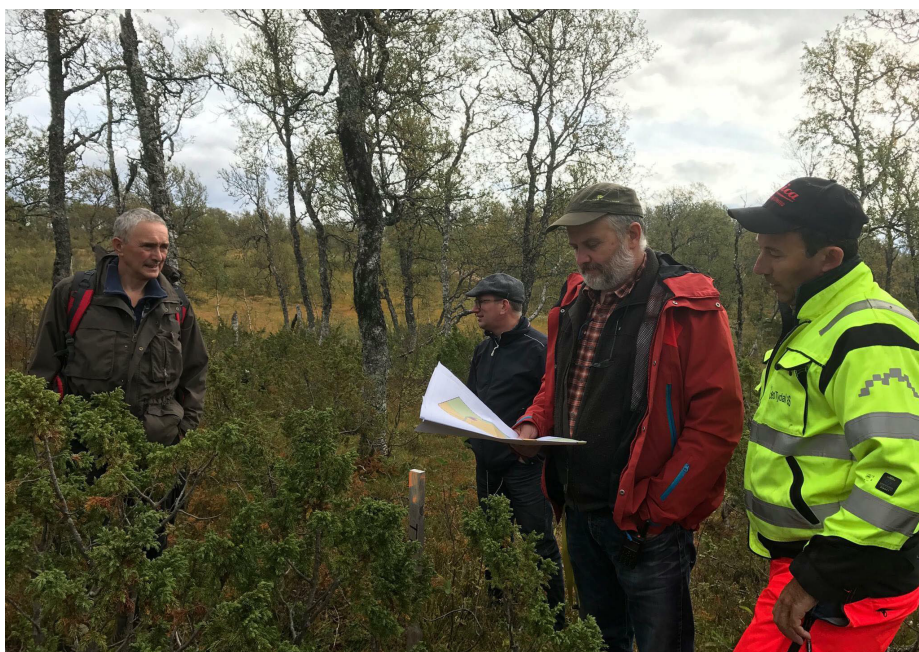
Sektor teknikk og miljø på befaring.

For mer inngående informasjon vises det til utfordringsdokumentet, oversikt over folkehelse og påvirkningsfaktorer i Tydal kommune og utredninga av Tydal som egen kommune (nullutredninga).