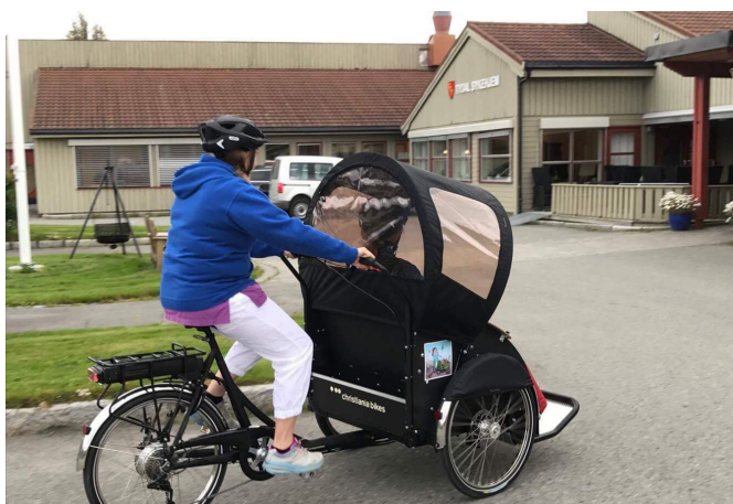
Aktivitetstilbud ved Tydal sykehjem.

Det skal være godt å bli gammel i Tydal. Folkehelseiltak og kommunale helsetjenester skal legge til rette for en god helse i alderdommen. Kulturelle tilbud gjennom kommunal og frivillig regi er viktig for god helse.