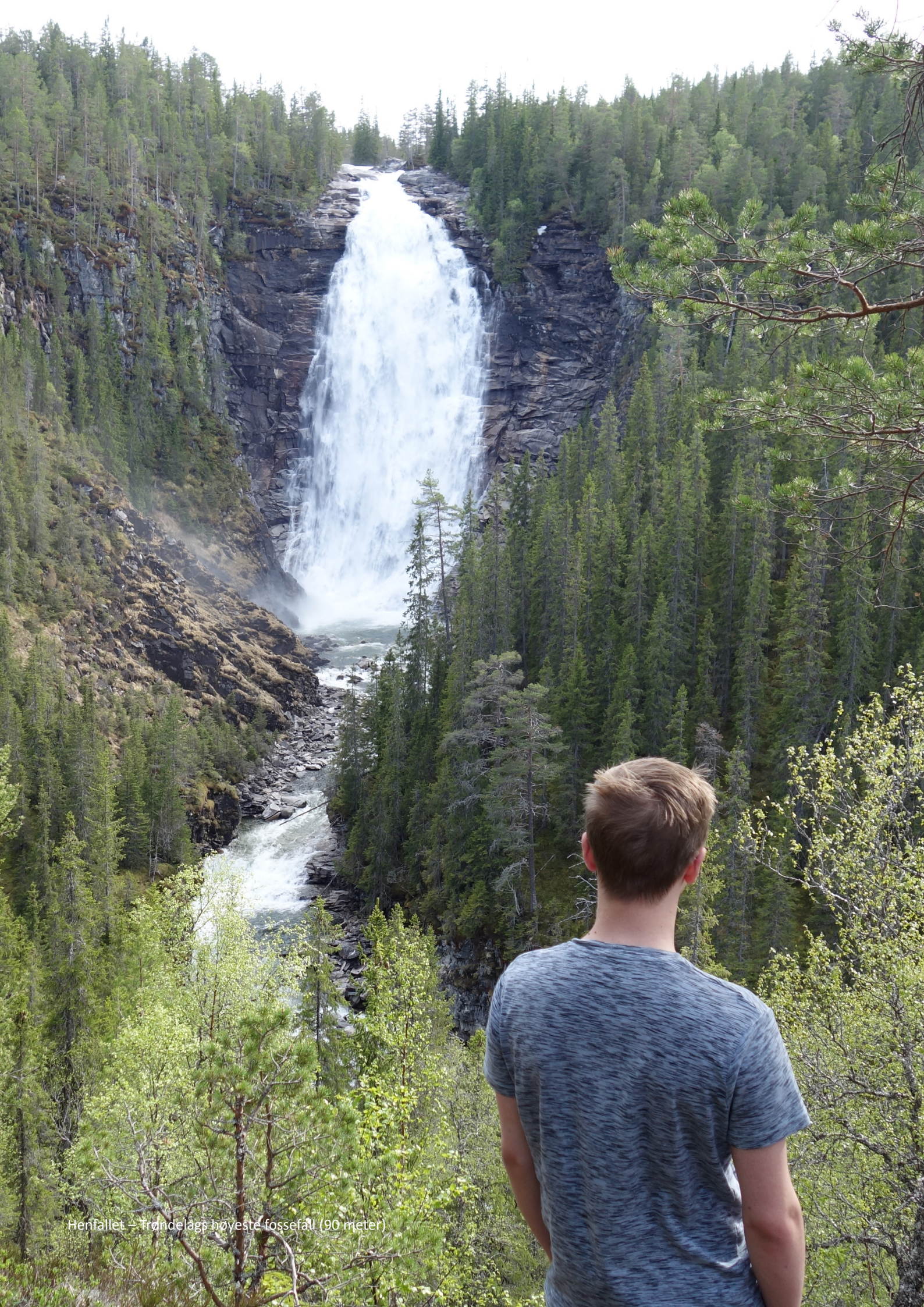
Henfallet – Trøndelags høyeste fossefall (90 meter)