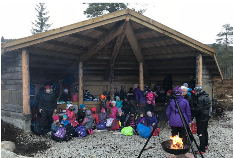
Barn på tur til gapahuk ved skolen